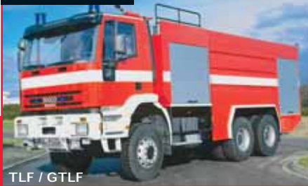
TLF / GTLF