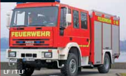
LF / TLF