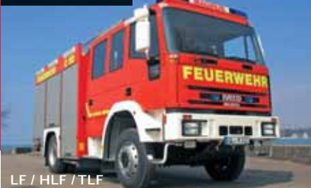
LF / HLF / TLF