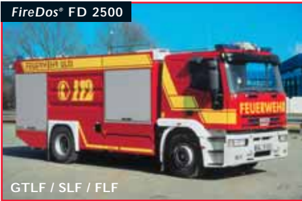
GTLF / SLF / FLF